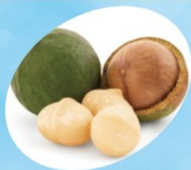
[マカデミアナッツ脂肪酸フィトステリル]