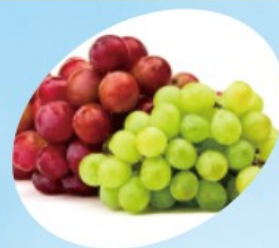
[グレープシード油]